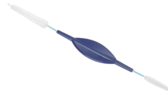
Écouvillon de nettoyage à double tête pour le piston d'irrigation Air/Eau

MICRO-TECH offre une solution complète pour le broyage des pistons et des orifices des valves air/irrigation. L'écouvillon double tête combine une brosse pour orifices de 40 mm de long et 11 mm d'épaisseur avec une brosse pour pistons de 20 mm de long et 5 mm d'épaisseur. Les deux brosses sont flexibles et dotées de billes de protection distales pour éviter d'endommager l'endoscope.