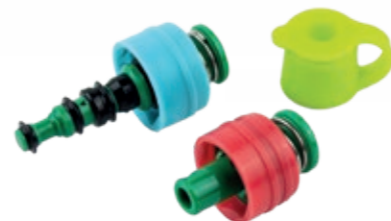
Kits en 3 parties (piston air/eau, d'aspiration et valve à biopsie)