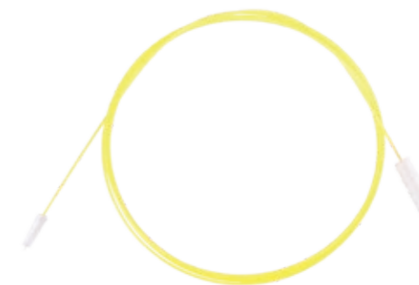
Écouvillon de nettoyage combiné

Brosse de nettoyage dotée d'une tête de brosse conique pour les canaux de l'endoscope, ainsi que d'une longue tête de brosse et de gros calibre pour les orifices des pistons d'air permettant de brosser les canaux et les orifices des valves avec une seule brosse de nettoyage, vous permettant ainsi de gagner du temps et de réduire les coûts.