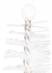
Tête de protection