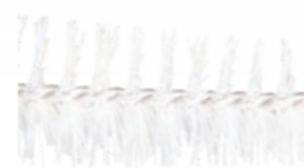
Écouvillons en nylon