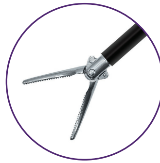
Pince à dissection Maryland