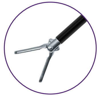
Pincès à préhension droites