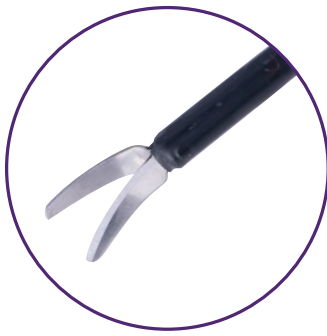
Ciseaux monopolaires Metzenbaum