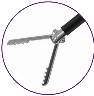
Pince laparoscopique LapClinch