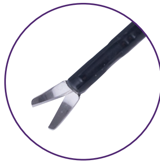
Mini Ciseaux monopolaires Metzenbaum