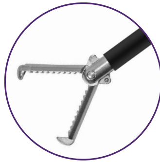
Pince LapClinch à dents de rat