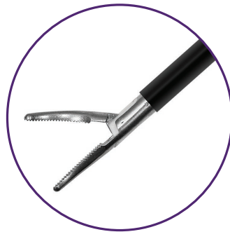
Pince à dissection bipolaire Maryland