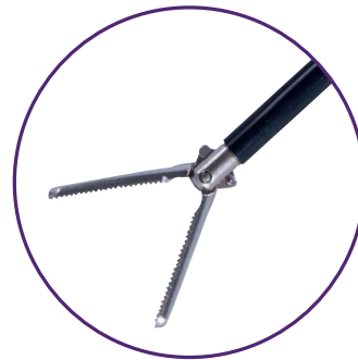
Pince à préhension West